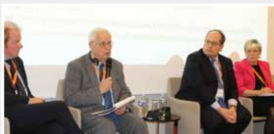
International Regulation Panel

Las aseguradoras de todo el mundo deberían recibir un trato normativo justo, de acuerdo con su naturaleza, escala y complejidad, según pudieron escuchar los asistentes a un reciente evento de AMICE-ICMIF.