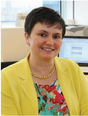
Hilde Vernailen Presidenta

Dentro de pocas semanas, seremos llamados a las urnas con motivo de las elecciones europeas. La composición del nuevo Parlamento Europeo se deberá tomar en cuenta cuando se nombre a un nuevo Presidente de la Comisión, y en otoño Europa dispondrá de una nueva Comisión para los próximos cinco años.