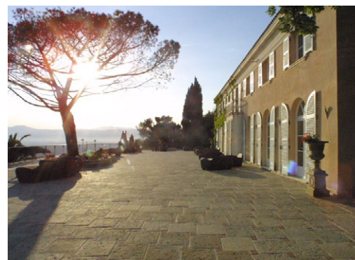
► Cena de gala en el Domaine de Mont Leuze